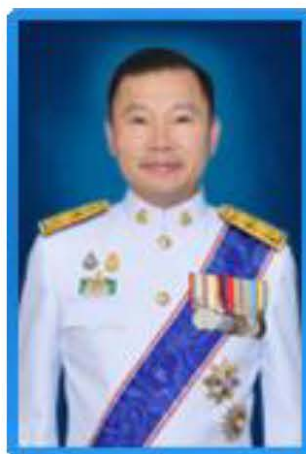
นายภาคล ถาวรกฤษรัตน์ อธิบดีกรมทรัพยากรน้ำ