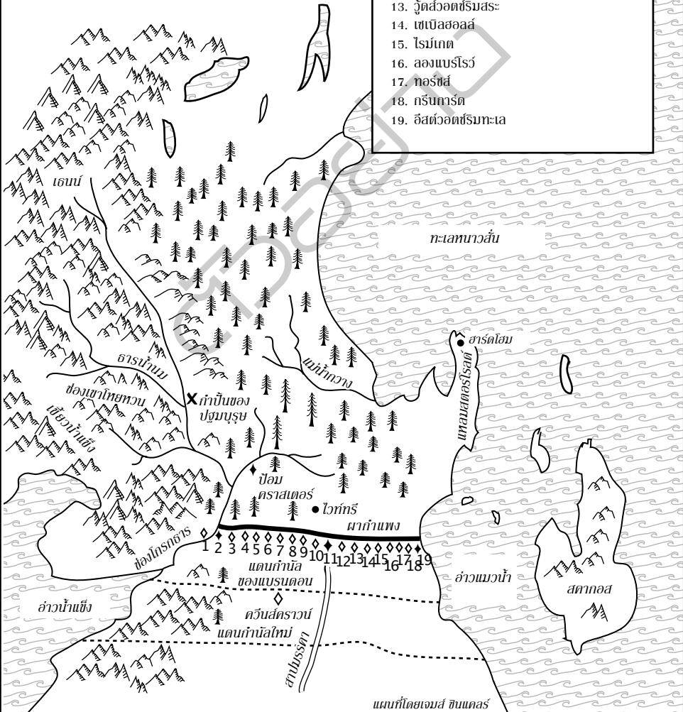
แผนที่โดยเจมส์ ซินเดอส

ดินแดนแห่งฤดูหนาวอันศกาว (ไม่ปรากฏในแผนที่)