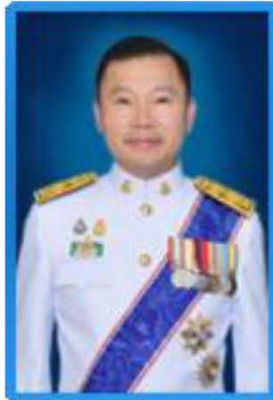
นายอากาศ อวรวงศ์รัตน์ อธิบดีกรมทรัพยากรน้ำ