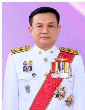
อธิบดีกรมสนับสนุนบริการสุขภาพ