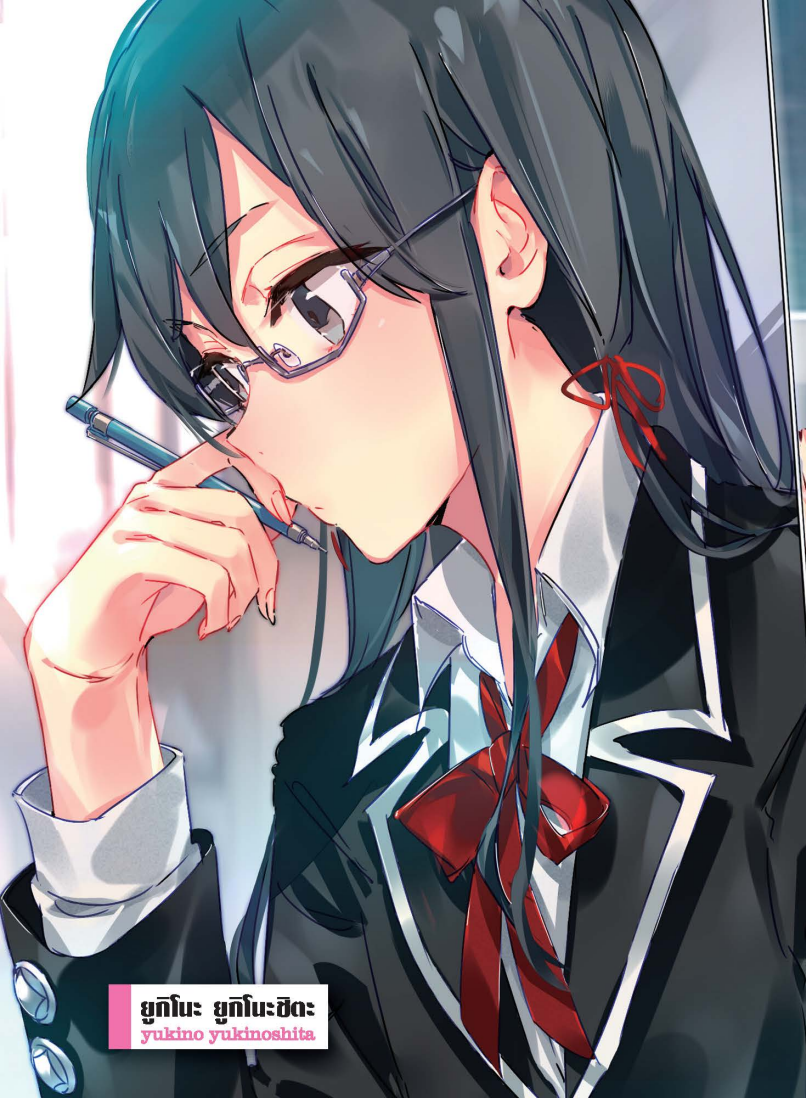
ຍຸກິໂນ: ຍຸກິໂນະຊິດະ yukino yukinoshita