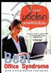
'3 ศาสตร์' ขจัดโรคออฟฟิศซินโดรม โดย ชีระวุฒิ ปัญญา ราคา 135 บาท