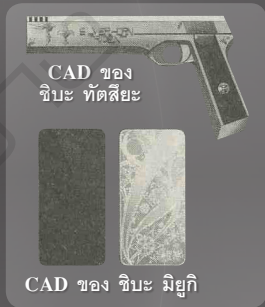
CAD ของ ชิบะ ทัดสึยะ

อุปกรณ์ช่วยอำนวยความสะดวกในการทำงานของเวทมนตร์ ภายในบรรจุโปรแกรมเวทมนตร์ มีประเภทและรูปร่างแตกต่างกันได้หลากหลาย มีทั้งแบบทั่วไปและเฉพาะทาง