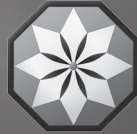
เอมเบลม ของนักเรียนชั้นหนึ่ง

ชื่อเรียกโดยรวมของโรงเรียนมัธยมปลายสาธิต มหาวิทยาลัยเวทมนตร์แห่งชาติ ที่ตั้งขึ้นทั้งหมดเก้าแห่งทั่วประเทศ ในจำนวนนั้น โรงเรียนมัธยมปลายลำดับที่ 1 ถึงลำดับที่ 3 มีการใช้ระบบจำแนกนักเรียนชั้นปีที่ 1 จำนวน 200 คน ออกเป็นนักเรียนชั้นหนึ่ง และนักเรียนชั้นสอง