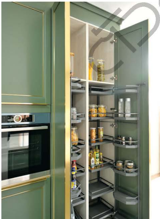
เอกเซอร์เซอร์ภายในตู้สูงเลือกใช้สีเทาเข้ม คุมเดดให้เข้ากับหน้าบานสีเขียว

“อีกหนึ่งความชัดเจนคือคุณมีมีชอบทำอาหาร อยากมีแค้ห้องครัวเดี่ยวเท่านั้น จึงขอเป็นครัวที่มีดีไซน์สวย ในขณะเดียวกันก็สามารถตอบโจทย์การใช้งานได้ในทุกๆ ฟังก์ชัน ตั้งแต่ทำอาหารหนักๆ รวมถึงทำขนมและเบเกอรี่ โดยผมจะเป็นคนเลือกเครื่องใช้ไฟฟ้าเองทุกชิ้น แล้วทาง สตาร์มาร์คจะกำหนดฟังก์ชันให้เป็นไปตามความเหมาะ สม เมื่อเปิดตู้หรือลิ้นชักจะมีฟังก์ชันซ่อนอยู่ทั้งหมด ซึ่งเรา ให้ความสำคัญกับเรื่องนี้มากๆ ไม่ได้สวยแค่ดีไซน์ภายนอก แต่พื้นที่ภายในก็ต้องจัดเต็มด้วยเช่นกัน