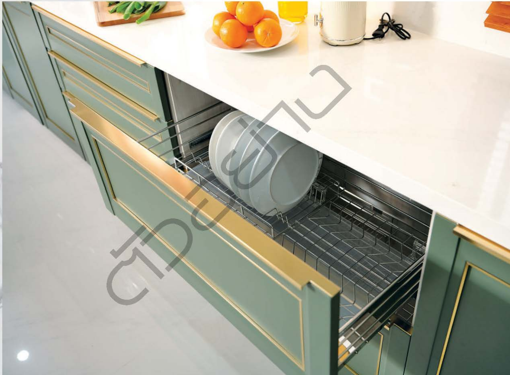
ภายในติดตั้งตะแกรงสำหรับเก็บจานชามให้เป็นระเบียบ แบ่งเป็นประเภท สะดวกต่อการใช้งาน