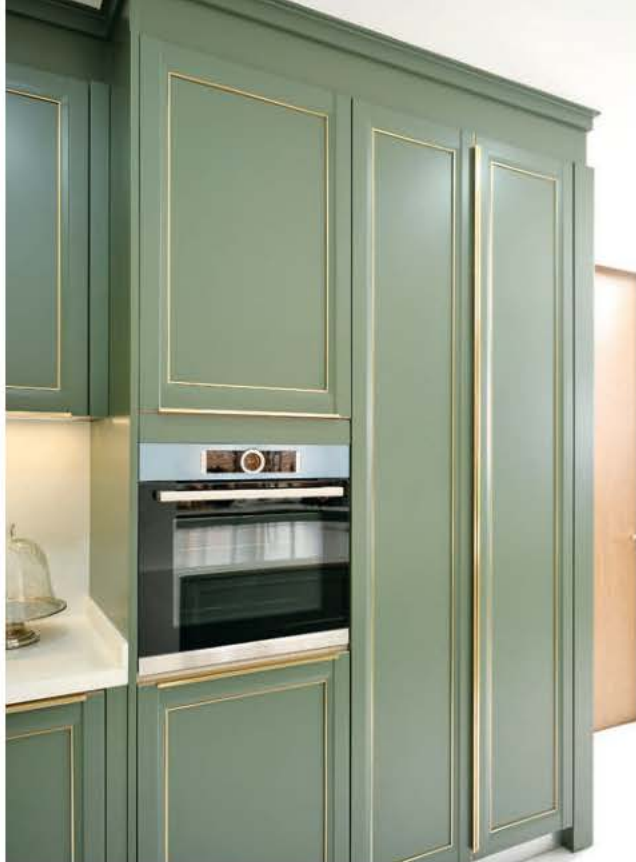
ใกล้กับเตาอบออกแบบเป็นตู้สูงสำหรับเก็บวัตถุดิบและของแห้ง