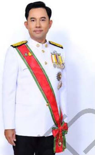
นายอิทธิพล คุณปลื้ม รัฐมนตรีว่าการกระทรวงวัฒนธรรม

เพื่อสร้างคนดี สังคมดี ปักฝังคุณธรรม สร้างค่านิยม “คุณธรรมนำการพัฒนา” และจิตสำนึกที่ดีแก่ประชาชน สร้างสังคมไทยให้เป็น “สังคมคุณธรรมที่ยั่งยืน” ต่อไป