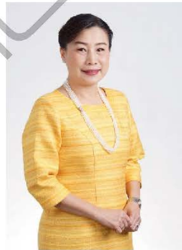
นางยุพา ทวีวัฒนะกิจบวร ปลัดกระทรวงวัฒนธรรม