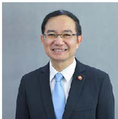
รศ.ดร.ประวิต เอราวรรณ์