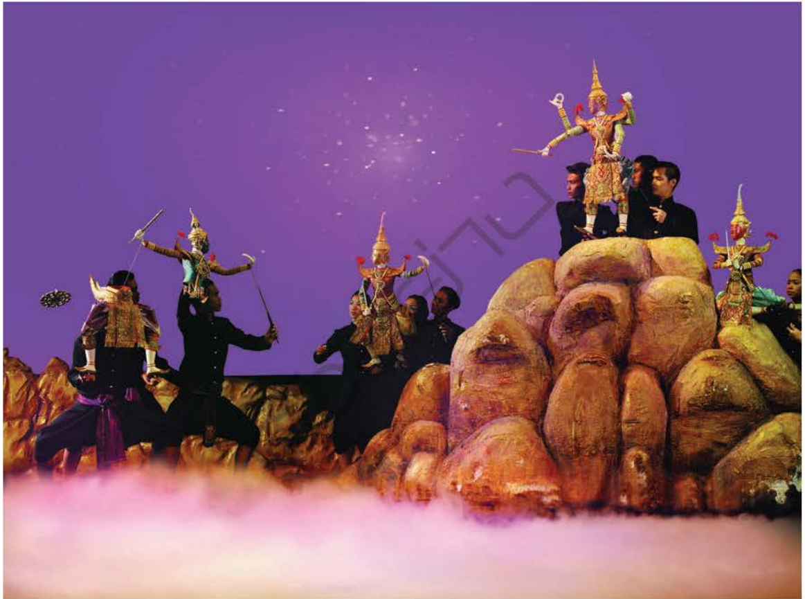
การแสดงหุ่นละครเล็ก