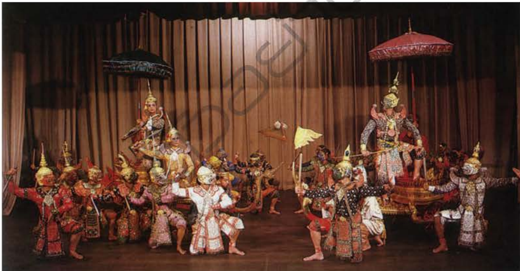
การแสดงโขน

๕. โขน หมายถึง ศิลปะการแสดงนาฏศิลป์ไทยประเภทหนึ่ง เวลาแสดงต้องมีการสวมหัวที่เรียกว่า “หัวโขน” ใช้สมมติให้เป็นตัวละครต่างๆ ตามหัวที่สวมใส่ เช่น หัวยักษ์ หัวลิง และหัวมนุษย์ ตัวพระ ตัวนาง และเทวดา นางฟ้า โดยจะสวมหัวเป็นชฎา มงกุฎ เป็นต้น โขนมี ๕ ชนิด ดังนี้