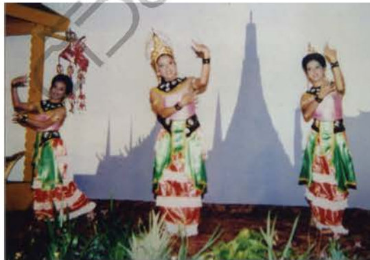
การแสดงท่ารำระบำสุโขทัย

(ภาพจากการแสดงสีภาคของมหาวิทยาลัยราชภัฏวไลยอลงกรณ์)