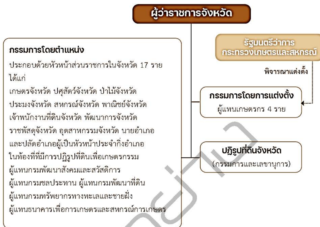
ภาพที่ 2.3 โครงสร้างของคณะกรรมการปฏิรูปที่ดินจังหวัด (คปจ.)

คณะกรรมการปฏิรูปที่ดินจังหวัดมีอำนาจหน้าที่และความรับผิดชอบในการกำหนดมาตรการและวิธีปฏิบัติงานของสำนักงานการปฏิรูปที่ดินจังหวัด และให้มีอำนาจหน้าที่และความรับผิดชอบดังต่อไปนี้