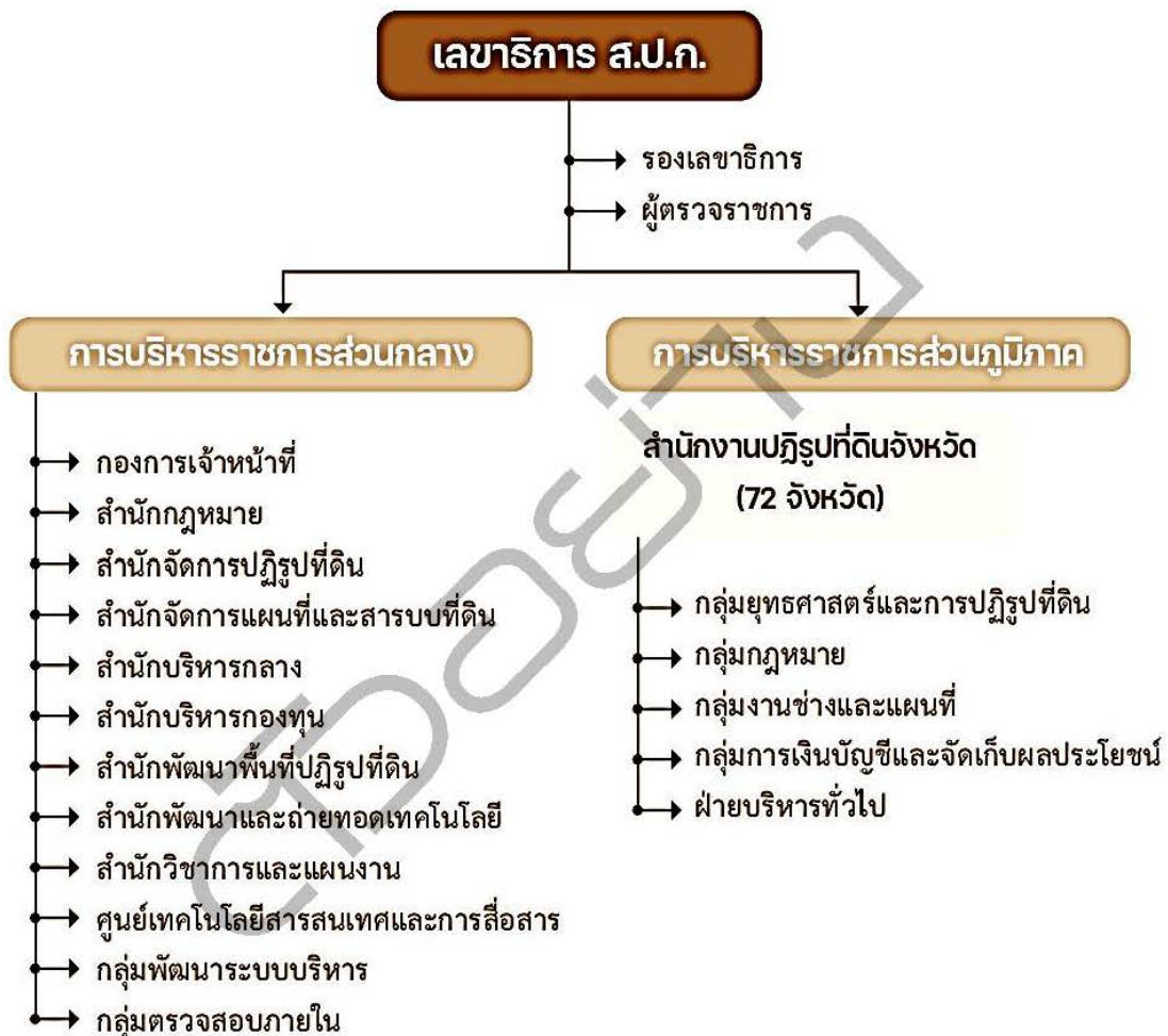
ภาพที่ 2.1 โครงสร้างของสำนักงานการปฏิรูปที่ดินเพื่อเกษตรกรรม

2) ส่วนภูมิภาค ประกอบด้วย สำนักงานการปฏิรูปที่ดินจังหวัด 72 จังหวัด ยกเว้น จังหวัดนนทบุรี สมุทรปราการ สมุทรสาคร สมุทรสงคราม และกรุงเทพมหานคร