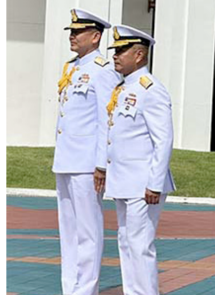
พล.ร.อ.จิรพล ว่องวิทย์และ พล.ร.อ.ไพโรจน์ เพ็ญจันทร์

ก ารเปลี่ยนผ่าน ผู้บัญชาการทหารเรือ คนใหม่ ดูจะเป็นไปด้วยความเรียบร้อย สถานการณ์สงบนิ่งเสมือนทะเลไร้คลื่น