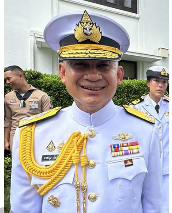
พล.ร.อ.ธาดาวุธ ทัดพิทักษ์กุล

Intelligent : อย่างถี่ถ้วน และใช้ไหวพริบปฏิญาณที่ดีในการแก้ไขปัญหาเฉพาะหน้า