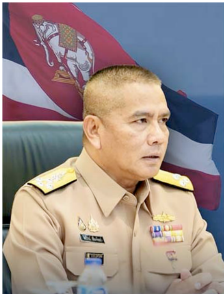
พล.ร.อ.ไพโรจน์ เพ็ญจันทร์