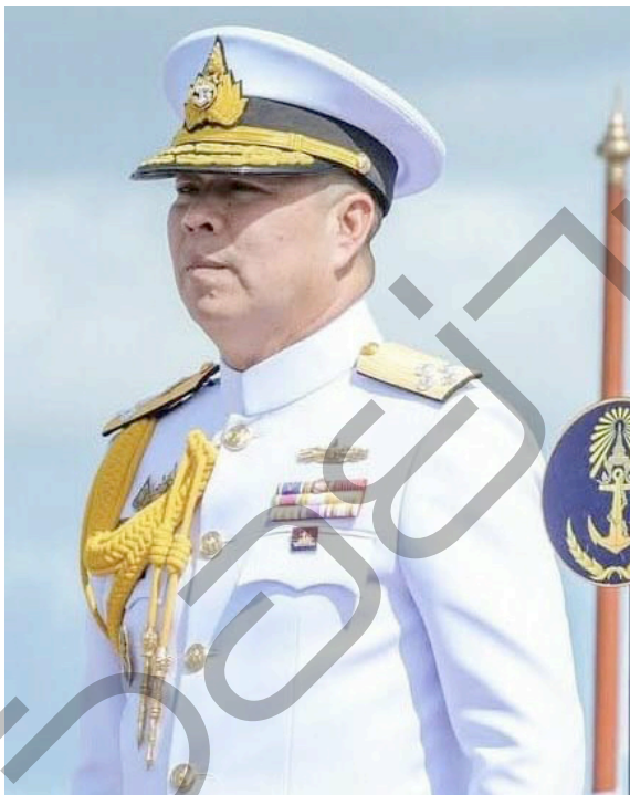
พล.ร.อ.ณัฐพล เตี้ยววานิช

เพราะต้องยอมรับว่าด้วยความที่ พล.ร.อ.อะดุง มีบุญคุณต่อ พล.ร.อ.จิรพล จึงทำให้คาดการณ์กันในกองทัพเรือก่อนหน้านี้ว่า พล.ร.อ.ณัฐพล หรือ พล.ร.อ.สุชาติ หรือ พล.ร.อ.พิจิตต์ จะได้ขึ้นเป็นผู้บัญชาการทหารเรือ แต่กระแสใน ทร. เริ่มเปลี่ยน ในช่วง 3 เดือนก่อนการ