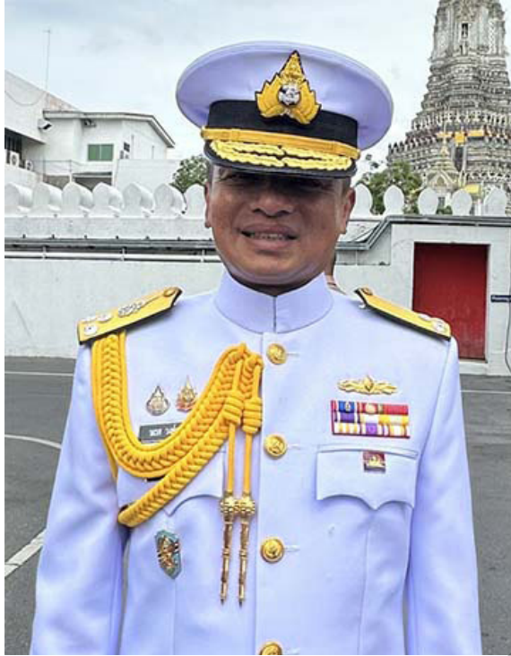
พล.ร.อ.นเรศ วงศ์ตระกูล

โดยที่ พล.ร.อ.นเรศ ซึ่งได้รับมอบหมายให้ดูแลเรื่อง โครงการเรือดำน้ำจีนมาตั้งแต่ต้น