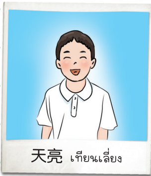
天亮 เทียนเหลียง