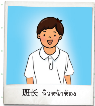
班长 หวังหน่าหวัง