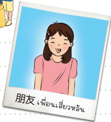
朋友 เพื่อนเสี่ยวหลี่