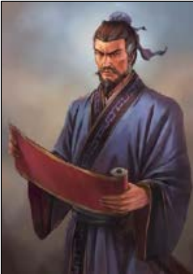
โลติด (Lu Zhi)

เล่าปี่จึงว่า ได้ยินข่าวว่าโลติดผู้เป็นตงลงเจียงเป็นทหารเอกพระเจ้าเลนเต้รบกับเตียวก๊กนายโจรอยู่ตำบลเมืองกงจ้ง ข้าพเจ้าจะขอทหารไปรบพวกโจร เจาเจิ้งจึงจัดทหารให้เล่าปี่ห้าร้อย เจาเจิ้งก็ยกทหารสี่พันห้าร้อยกลับมาเมืองตุนก้วน ฝ่ายเล่าปี่กวนอูเตียวหุยก็ยกไปถึงเมืองกงจ้ง แล้วชวนกันไปหาโลติด จึงเอาข้อราชการซึ่งได้รับโจรนั้นแจ้งแก่โลติด ๆ ยินดีนัก จึงว่าท่านทั้งสามอยู่ทำราชการด้วยเราเถิด