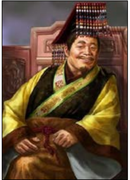
พระเจ้าเลนเต้ (Emperor Ling)

เหตุทั้งนี้เพราะพระเจ้าฮั่นเต้ ๓ หาพระราช บุตรมิได้ ขอเล่นเต้มาเลี้ยง จนเล่นเต้ได้เสวยราชย์มี พระราชบุตรสององค์ ชื่อหองจูเปียนหนึ่ง หองจูเหียบ หนึ่ง แลเมืองพระเจ้าเลนเต้เสวยราชย์นั้น มิได้ตั้งอยู่ในโบราณราชประเพณี แลมิได้คบหาคนสัตย์ธรรม เชื้อถือแต่คนอันเปนอาสัตย์ ประพฤติแต่ตามอำเภอใจ แห่งพระองค์เสวยราชประเพณีไป จึงมีขันทีผู้ใหญ่คน หนึ่งชื่อเทาจี้ดกับพวกขันทีทั้งปวง เห็นว่าพระเจ้า เลนเต้รักใคร่ไว้พระทัย จึงคิดกันกระทำการหยาบฆ่า ต่าง ๆ แต่บันดาราชกิจสิ่งใดนั้น ขันทีว่ากล่าวเอาผิด เปนชอบ ขุนนางแลอาณาประชาราษฎร์ได้รับความ เดือดร้อนนัก จึงมีขุนนางผู้ใหญ่ทั้งสองชื่อเตาบูตันผวน เห็นผิดคิดอ่านจะจับขันทีฆ่าเสีย เทาจี้ดขันทีรู้ตัวจึง ให้พักรพวกจับเตาบูตันผวนไปฆ่าเสีย เทาจี้ดแล พวกขันทีทั้งปวงยังทำการกำเริบขึ้นกว่าแต่ก่อน