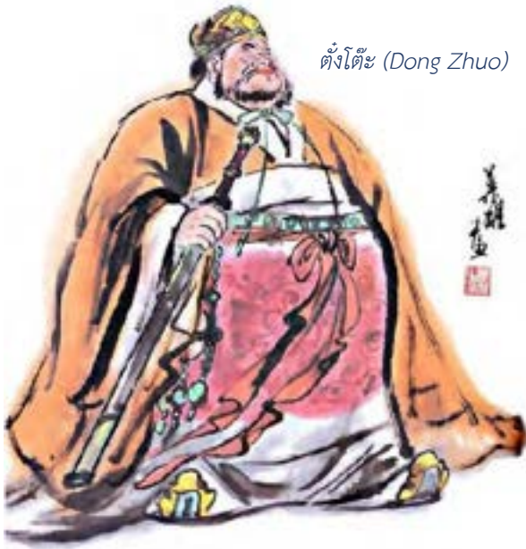
ตั้งโต๊ะ (Dong Zhuo)

ไถ่มา เล่าปีเห็นธงสำคัญจึงรู้ว่าทัพ เดียวก็ไล่ทัพตั้งโต๊ะมา เล่าปีกวนอู เดียวหุยจึงลงไปช่วยรบ ทัพเดียวก็ กลับแตกหนีไปทางประมาณห้าร้อย ตั้งโต๊ะจึงได้กลับไปค่าย แล้วให้หา เล่าปีกวนอูเดียวหุยมาถามว่า ตัวนี้ เป็นขุนนางตำแหน่งใด เล่าปีบอกว่า ข้าพเจ้าจะได้เป็นตำแหน่งที่ขุนนาง นั้นหาไม่ได้ ตั้งโต๊ะได้ยินดังนั้นทำ กริยาดูหมิ่นมิได้นับถือ เล่าปีกวนอู เดียวหุยก็ลาออกมา เดียวหุยจึงว่า เราพี่น้องสามคนช่วยเอาชีวิตมันไว้ รอดมันก็ไม่รู้คุณเรา กลับทำหยาบซ้ำ