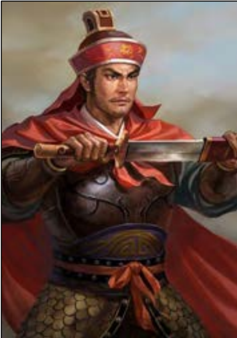
ซุนเกี้ยน (Sun Jian)

ว่า ครั้งพระเจ้าฮั่นโกโจนั้น บ้านเมืองมิได้ปรกติมีเสี้ยนหนามเปนอันมาก พระเจ้าฮั่นโกโจจึงรับเกลี้ยกล่อมคนทั้งปวง ครั้งนี้มีจลาจลแต่โจรพวกเดียว ครั้นจะเอาพวกโจรเข้าไปในเกลี้ยกล่อม คนทั้งปวงก็จะดูเยี่ยงอย่างว่าทำผิด แต่ถ้ามีผู้มาปราบปรามก็จะละพยศอันร้ายเสีย นานไปก็จะรื้อทำความชั่วไปอีก เล่าปี่จึงตอบว่าควรแล้ว แต่ซึ่งเราล้อมเมืองไว้นี้ก็รอบทั้งสี่ด้าน เมืองก็จวนจะเสียอยู่แล้ว อันพวกโจรก็เปนชายชาติทหาร อุปมาเหมือนสุนัขจวนตลอก ไหนจะนิ่งให้ทหารเราจับโดยง่าย คงจะรบเปนสามารถ ทหารเราก็จะเสียบ้าง พวกโจรก็จะเสียบ้าง เหมือนเอาพิมเสนไปแลกเกลือ ขอให้ยกทหารด่านตัวนอกเสีย เปิดให้พวกโจรออกไป จึงค่อยตามจับเอาเห็นจะได้สะดวก จูสีเห็นชอบด้วย สั่งทหารให้เลิกด่านตัวนอกเสียแล้วมารุมตี ฮั่นต่งจึงยกพลหนีออกจากเมืองด่านตัวนอก จูสีเล่าปี่กวณอุเดียวหุยสี่นายคุมทหารไล่ไป แล้วยิงเกาทัณฑ์ไปถูกฮั่นต่งตาย ทหารทั้งนั้นก็แตกไป