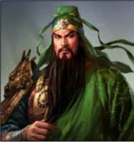
กวนอู (Guan Yu)

เล่าปี่จึงว่าเราเป็นเชื้อพระเจ้าฮั่นเกงเต้ชื่อเล่าปี่ ได้ยินข่าวว่าโจรโพกผ้าเหลืองมาทำอันตรายแผ่นดิน เราคิดจะใคร่อาสาแผ่นดินไปปราบโจร แต่ขัดสนด้วยกำลังน้อยทรัพย์ก็น้อยคิดไปมิตลอด จึงทอจิตใจใหญ่ เทียวหุยจึงว่าทรัพย์นั้นเรามีอยู่ เราจะคิดกันไปเกลี้ยกล่อมชาวเมืองซึ่งมีฝีมือกล้าหาญ ท่านกับเราจะยกออกไปจับโจรจะเห็นประการใด เล่าปี่ได้ฟังก็ดีใจจึงชวนเตียวหุยเข้าไปในบ้านสุราซื้อสุราแล้วก็ชวนกัน นั่งกินอยู่