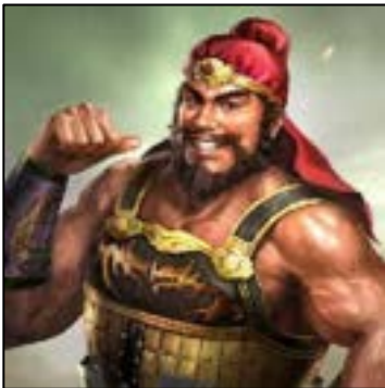
เตียวหุย (Zhang Fei)

มีคนหนึ่งยืนอยู่ข้างหลังเล่าปี่แล้วว่า เป็นผู้ชายไม่ช่วยทำนุบำรุงแผ่นดินแล้วสิมาทอดใจใหญ่ ฝ่ายเล่าปี่กลับหน้ามาดู เห็นผู้นั้นสูงประมาณห้าศอก สีสะเหมือนเสือ จักขุกลมใหญ่ คางพองโต เสียงดังฟ้าร้อง กิริยาดังม้าควบ เห็นผิดประหลาดจึงถามว่าท่านนี้ชื่อใด ผู้นั้นจึงตอบว่าเราชื่อเตียวหุย เอ๊กเต็กบ้านอยู่ตั้นก้วน เรามีทรัพย์สินไร่นาเป็นอันมาก ทั้งร้านสุกรสุราก็มีชาย เราพอใจคบเพื่อนฝูงซึ่งมีสติปัญญา บัดนี้เห็นท่านดูหนังสือแล้วทอดใจใหญ่จึงทักจะใครู้เนื้อความ