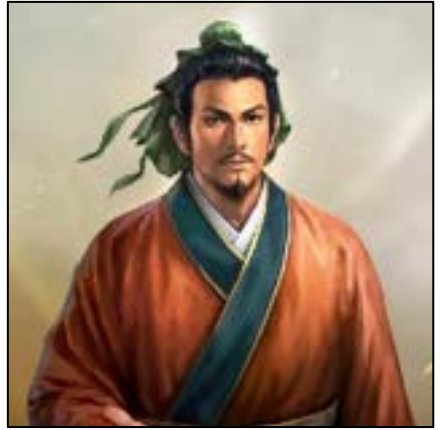
เล่าปี่ (Liu Bei)

แลเมืองตั้นก้วนมีชายคนหนึ่งชื่อเล่าปี่ เมื่อน้อยชื่อเหียนเต็ก ก็ไม่สู้รักเรียนหนังสือแต่มีปัญญา น้ำใจนั้นดี ความโกรธความยินดีมิได้ปรากฏออกมาภายนอก ใจนั้นอารีย์นักมีเพื่อนฝูงมาก ใจกว้างขวาง หมายถึงเป็นใหญ่กว่าคนทั้งปวง กอไปด้วยลักษณะรูปใหญ่สมบุรณสูงประมาณห้าศอกเศษ หุยานถึงบ่า มีเอวถึงเข่า หน้าขาวดั่งสีหยก ฝีปากแดงดั่งชาด แต้ม จักขุชำเลืองไปเห็นหู แลเล่าปี่นั้นเป็นบุตรเล่าเหง เล่าเหงเป็นเชื้อวงศ์พระเจ้าฮั่นเกงเต้ เล่าเหงตายตั้งแต่ภรรยา เล่าปี่ผู้บุตรมีกตัญญูรักขามารดา มิให้อาหาร แลเล่าปี่กับมารดาเป็นคนซื่อใจไร้ทรัพย์สิน ทอเสื้อขายเลี้ยงชีวิต บ้านที่เล่าปี่อยู่นั้น ชื่อบ้านเล่าของฉุนอยู่ใกล้เมืองตั้นก้วน เรือนนั้นอยู่ริมต้นหม่อน ๆ นั้นสูงประมาณแปดวาเศษ กิ่งนั้นเป็นพุ่มดั่งฉัตร มีหมอดูคนหนึ่งเดิรมาเห็นภูมิบ้านแลต้นหม่อนดั่งตำรา จึงทายว่าบ้านนี้มีผู้มีบุญอยู่ เล่าปี่เมื่อยังเด็กอยู่นั้น เล่นกับลูกชาวบ้านทั้งปวง เล่าปี่จึงว่า ถ้ากูได้เป็นเจ้ากูจะเอาต้นหม่อนต้นนี้ไปทำคันเศวตฉัตรกัน เล่าฮ้วนก็ผู้เป็นอาว์ได้ยินเล่าปี่ว่าประหลาด จึงชมเล่าปี่ว่าจะมีบุญเป็นมั่นคง เล่าฮ้วนก็ทำนุบำรุงให้เงินทองแก่เล่าปี่เนื่อง ๆ เมื่อเล่าปี่อายุได้สิบห้าปี มารดาจึงให้ไปเรียนหนังสือกับเต้เหียนผู้เป็นครู เล่าปี่นั้นมีเพื่อนสองคน ชื่อโลติดหนึ่ง กองซุนจ้านหนึ่ง เรียนหนังสืออยู่ด้วยกันจนอายุได้สิบห้าปี ขณะนั้นเล่าปี่เดิรไปเห็นหนังสือซึ่งปิดไว้ที่ประตูเมือง เล่าปี่คิดไปมิตลอดยื่นดูหนังสือทอดใจใหญ่อยู่