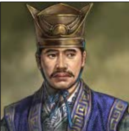
บันเฮ็ก (Wan Yu)

ขณะนั้นบันเฮ็กเดียวเป่าขุนนางผู้ใหญ่จึงปรึกษาว่า ซึ่งจะยกซุนเปียนผู้เปนพระราชบุตรขึ้นว่าราชการเมืองนั้นก็ชอบอยู่ แต่ที่ว่าซุนเปียนนี้มีสติปัญญาน้อยยิ่งเยาว์แก่ความนัก เห็นจะว่าราชการไปมิตลอด ขอให้เอาซุนโฮซึ่งเปนหลานพระเจ้าซุนกวน อันเปนบุตรของซุนเหลียงนั้นครอบครองราชสมบัติเถิด ด้วยมีสติปัญญาหลักแหลมเห็นจะปกป้องอาณาประชาราษฎร์ได้