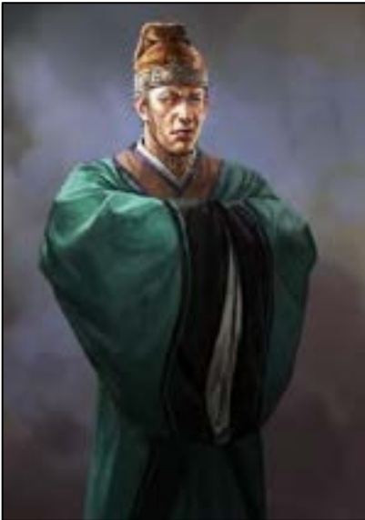
เตียวเหยียง (Zhang Rang)

ครั้นถึงเดือนหกขึ้นค่ำหนึ่ง เกิดนิมิตเป็นควันเพลิงพุ่งขึ้นไปสูงประมาณยี่สิบวา แล้วควันเพลิงนั้นพุ่งเข้าไปในพระที่นั่งอุตักเตียน ครั้นณเดือนเจ็ดเกิดนิมิตรัศมีรุ่งตกลงในพระราชวัง แลเขารันชิวสูงใหญ่บันดาลแตกทลายลง พระเจ้าเลนเต้จึงถามขุนนางทั้งปวงว่า นิมิตวิปริตดังนี้จะดีร้ายประการใด ยีหลงขุนนางจึงเขียนหนังสือลับกราบทูลว่า เหตุทั้งปวงนี้เพราะชั้นที่ประพุดล่องพระราชอาญา จึงเกิดนิมิตให้พระองค์ปรากฏ