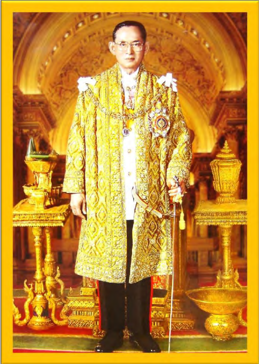
พระบาทสมเด็จพระปรมินทรมหาภูมิพลอดุลยเดช มหิตลธิเบศรราชวโรดม บรมนาถบพิตร จักรีนฤพดินทร สยามินทร์อารีราช บรมนาถบพิตร