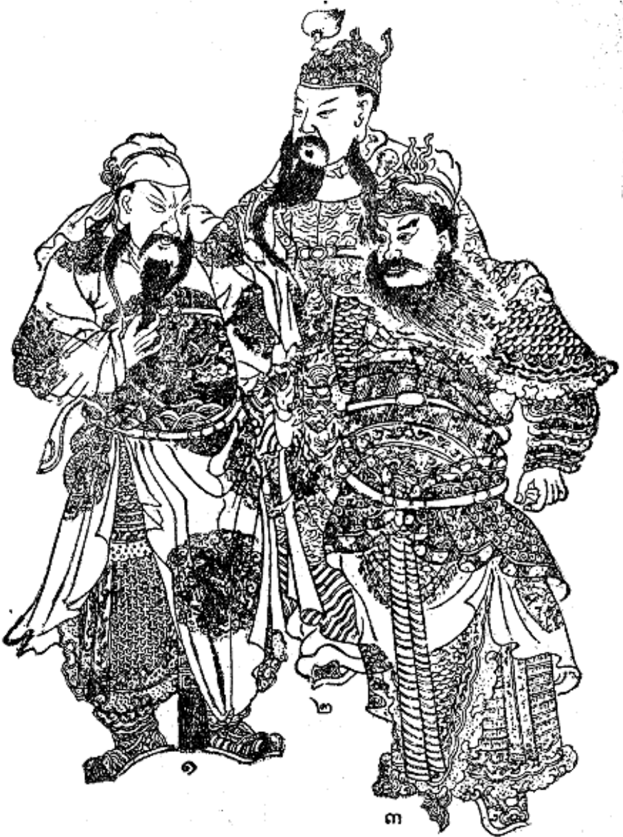
๑. กวนอู. ๒. เล่าปี่. ๓. เตียวหุย