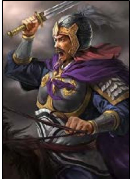
ฮองฮูสง (Huangfu Song)

ฝ่ายฮองฮูสงกับจูฮันตั้งทหารออกรบกับพวกโจรยังมีแพ้ชนะกัน พันเวลาแล้วเดี๋ยวไปเที่ยวเหลียงให้ทหารถอยเข้ามาที่มั่น แล้วให้อาพางทำชุมรุมขึ้นในค่าย ฝ่ายฮองฮูสงกับจูฮูรู้จึงปรึกษากันว่า บัดนี้พวกโจรเอาพางทำชุมรุมขึ้นในค่าย เราจะคิดเอาเพลิงเผาค่ายพวกโจรเสียจงได้ จึงให้ทหารมัดหญ้าคนละมัด ให้ชุดอุโมงค์เข้าไปถึงริมค่ายโจรให้อาพางไปกองชุมไว้ตามริมค่าย ครั้นเวลากลางคืนประมาณสองยามเกิดลมพายุใหญ่พัดหนักทหารทั้งปวงได้ที่ให้สัญญาพร้อมกันแล้ว จุดเพลิงระดมเผาค่ายโจรไหม้ขึ้นสิ้น แสงเพลิงดุจกลางวัน พวกโจรทั้งปวงตกใจมีทันใส่เกราะแลผูกอานม้า ก็แตกกระจายหนีเพลิงร่นวายอยู่ ฮองฮูสงจูฮูซิบทหารเข้าไล่แทงฟันพวกโจรป่วยเจ็บล้มตายเป็นอันมาก