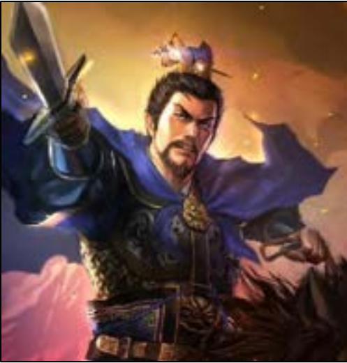
โจโฉ (Cao Cao)

ครั้นรุ่งขึ้น เตียวโป้ เตียวเหลียง กับพวกโจรซึ่งเหลือนั้นก็ชวนกันหาทางที่จะหนีเอาชีวิตรอด จึงไปพบทัพหนึ่งธงแดงทั้งทัพ ทหารกองหน้าเข้าสกัดพวกโจรไว้มิให้หนีได้ แลนายทัพนั้นชื่อโจโฉ สูงประมาณห้าศอก จักขุเล็ก หนวดยาว เปนบุตรโจโก้ แลโจโฉเมื่อน้อยนั้นมักพอใจไปเล่นปายิ่งเนื้อ มักพอใจฟังร้องรำทำเพลงมีปัญญาความคิดรวดเร็ว ฝ่ายว่าโจเต๊กนั้นเห็นโจโฉเปนนักร้องไม่ทำมาหากิน ก็มีใจชิงเปนอันมาก จึงเดิรไปจะเอาเนื้อความบอกโจโก้ผู้พี่ โจโฉเห็นว่าอ่าวซึ่งอยู่จะเอาเนื้อความไปบอกบิดา โจโฉทำมีอันเปนล้มลง อ่าวเห็นจึง