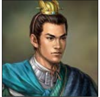
ลกข่อง (Lu Kang)

เอียวเก๋าคืนแจ้งในข้อรับสั่งแล้ว ก็กะเกณฑ์ทหารออกไปตั้งรักษาผ่านทางอยู่ทุกตำบล ครั้นมาวันหนึ่งทหารจึงเข้าไปบอกว่า บัดนี้ลักข่องนายทหารซึ่งยกมาตั้งอยู่ ณ ปลายแดนนั้นก็เรรวนพันเพื่อนอยู่แล้ว ทแก่แล้วทหารก็มิได้คุมกันเพนหมวดกองโดยกระบวร ขอให้ท่านเร่งยกทหารไปโจมตีเอาเห็นจะได้ชัยชนะโดยง่าย เอียวเก๋าก็ว่า อันลักข่องนี้มีสติปัญญาเพนสามารถ ทั้งฝีมือก็เข้มแข็ง เพนนายทหารใหญ่ในเมืองกังตั้ง ชำนิชำนาญในการสงครามมาช้านาน ซึ่งท่านจะประมาทดูเบาให้ยกไปตีลักข่องนั้นมิชอบ เราไม่เห็นด้วย ถ้าแลตั้งมั่นรออยู่ฟังกิตติศัพท์เมืองกังตั้ง เห็นได้ทีแล้วจึงจะยกไปโจมตีเอาอย่าให้รู้ตัวจะมีตีหรือ ทหารทั้งปวงได้ฟังดังนั้นก็นำบเห็นชอบด้วย เอียวเก๋าก็ตั้งมั่นรอฟังกิตติศัพท์อยู่ ณ ปลายแดน