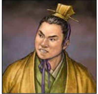
ขุนโฮ (Sun Hao)

ครั้นขุนนางทั้งปวงได้ยินเสนาผู้ใหญ่ทั้งสอง ปรีกษานั้น ก็เห็นพร้อมด้วยกันสิ้น ครั้นถึงเดือนเก้าขึ้นค่ำ หนึ่ง ก็แต่งการพระราชพิธีอภิเษกขุนโฮขึ้นครอบครองราช สมบัติสืบไป จึงตั้งให้ขุนโฮเป็นผู้เป็นพระราชบุตรของพระ เจ้าขุนฮิวเป็นที่เจ้าเจียงอ่อง ให้เตงฮองเปนที่ต่ายสุม่า ครั้นพระเจ้าขุนโฮได้เสวยราชสมบัติแล้วก็มีพระทัยกำเริบ เชื้อฟังก้อยคำจิมหุนผู้เปนขันที มิได้เอาใจใส่กิจการ บ้านเมืองทั้งปวงเสพย์สุราเปนิจ เอียงเหียงเดียวเป่าซึ่ง เปนขุนนางผู้ใหญ่เห็นผิดก็เข้าไปทูลทัดทานห้ามปราม เปนหลายครั้ง พระเจ้าขุนโฮมิได้เชื่อฟังโกรธขุนนางทั้งสอง คนก็สั่งให้เอาตัวไปฆ่าเสีย ตั้งแต่นั้นมาขุนนางทั้งปวงก็กลัวเกรงมิอาจที่จะห้ามปรามทูลทัดทานได้